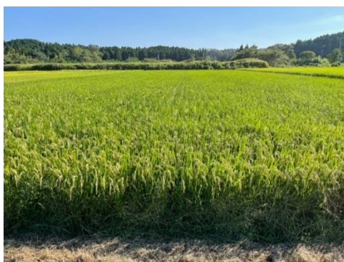
富岡町でのさくら福姫の栽培